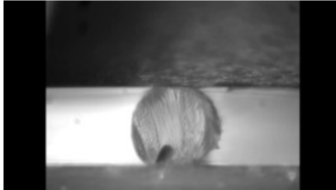
Figure 2 : Exemple d'image de section transverse d'une fibre de PA11 utilisée pour la détermination du module transverse par corrélation d'image intégrée.

(images de la section droite, voir Fig 2, et de la force) enregistrées lors de la décharge, du modèle analytique développé et des valeurs du module longitudinal et du coefficient de Poisson déterminés préalablement grâce à un essai de traction sur fibre élémentaire.